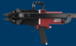
Agrafage à gabions