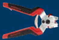
Agrafage à grillage